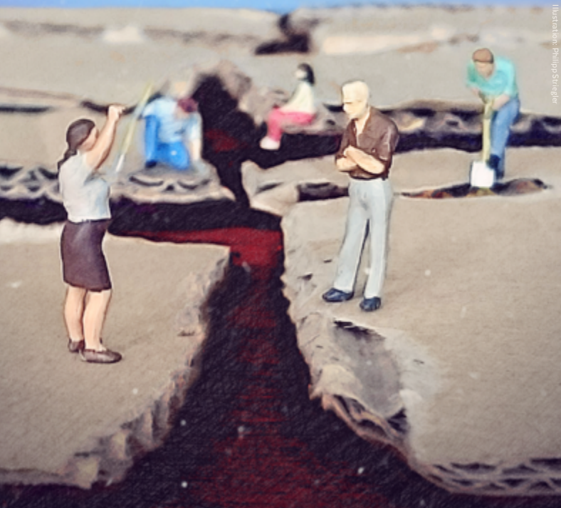
Illustration: Philipp Straßler Painting: Art Eco (courtesy of Theatre for Living)

10.09.2015 / 19-22UHR / THEATER AM G-WERK